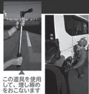
この道具を使用して、増し締めをおこないます

ナットの締め過ぎはボルトの破損、ナットの締めが弱いとナットが緩み、外れの原因となります。