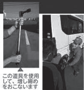
この道具を使用して、増し締めをおこないます

ナットの締め過ぎはボルトの破損、ナットの締めが弱いとナットが緩み、外れの原因となります。