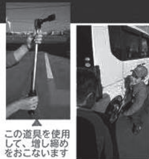
この道具を使用して、増し締めをおこないます

ナットの締め過ぎはボルトの破損、ナットの締めが弱いとナットが緩み、外れの原因となります。