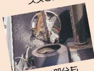
見えない部分も ほこりいっぱい!