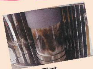
見た目は ススで真っ黒...